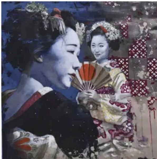
Sopra: Sisters , 2023, acrilico su tela, 100x100 cm; Nella pagina accanto: A short walk in the garden , 2022, acrilico su tela, 50x50 cm.

Se vogliamo considerare il viaggio come uno spostamento con una partenza e una destinazione, un percorso durante il quale si acquisiscono sensazioni e pensieri, posso dire che il dipinto per me è la perfetta rappresentazione del percorso stesso. L'idea iniziale immaginata (la meta), la preparazione dei materiali (fare i bagagli), le prime pennellate che definiscono le forme (la partenza), i colori che definiscono volumi e spazi (il percorso), il completamento dei dettagli (l'arrivo). In tutti i miei lavori utilizzo sempre un modello estetico per stimolare un pensiero, faccio in modo così che sia lo spettatore a dare il suo significato all'opera. Per me il Giappone, il mondo e il modo giapponesi, sono gli strumenti appropriati per una riflessione sul tempo, la bellezza e la nostra evoluzione socio-culturale. In Giappone è uso utilizzare un'espressione, un'immagine per rappresentare un concetto. Questo