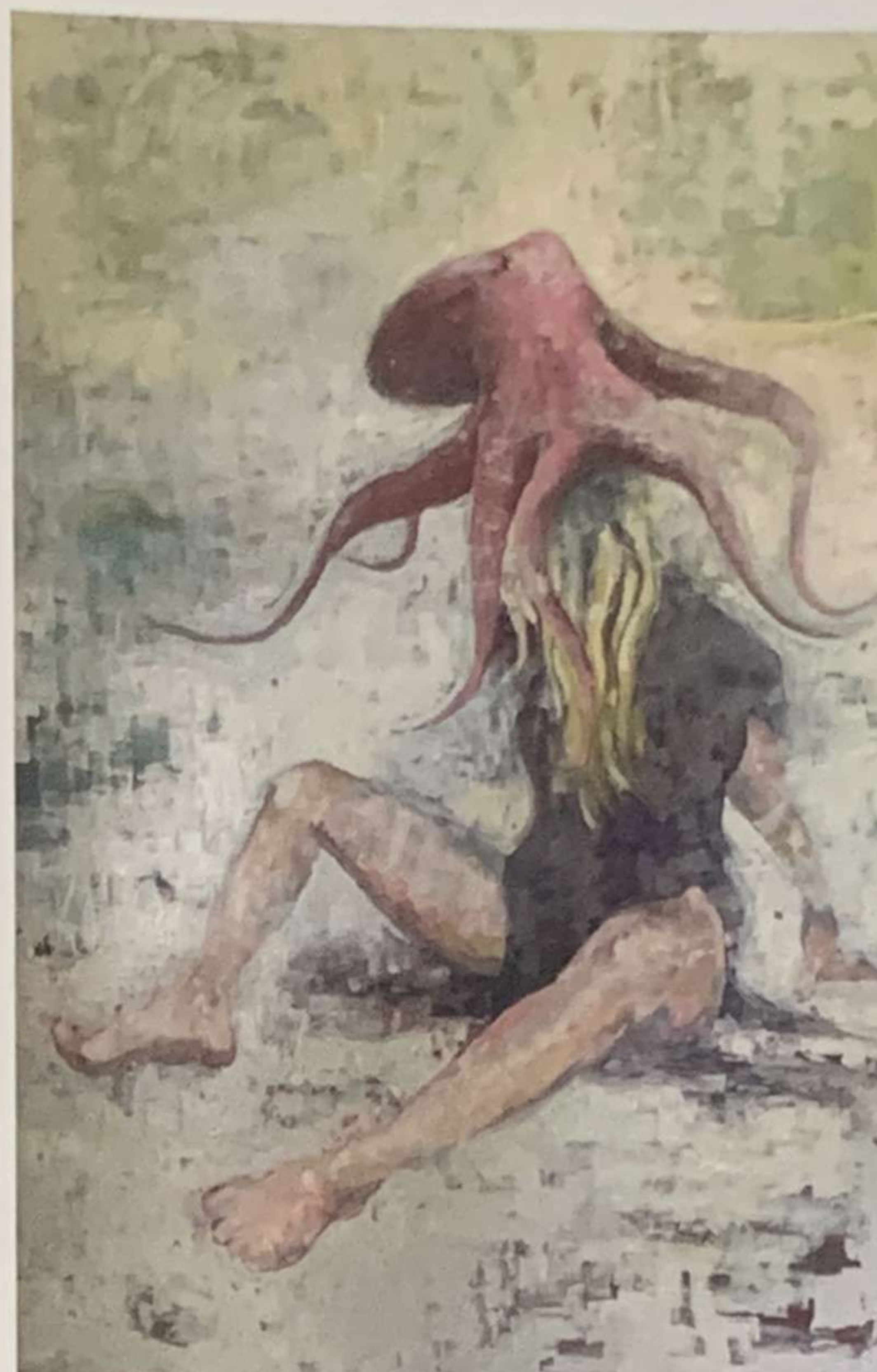
Dancing in the water , 2021, olio su tela, 80x100 cm; You smell like peaches or is that me , 2019, oil on cotton, 116x81cm