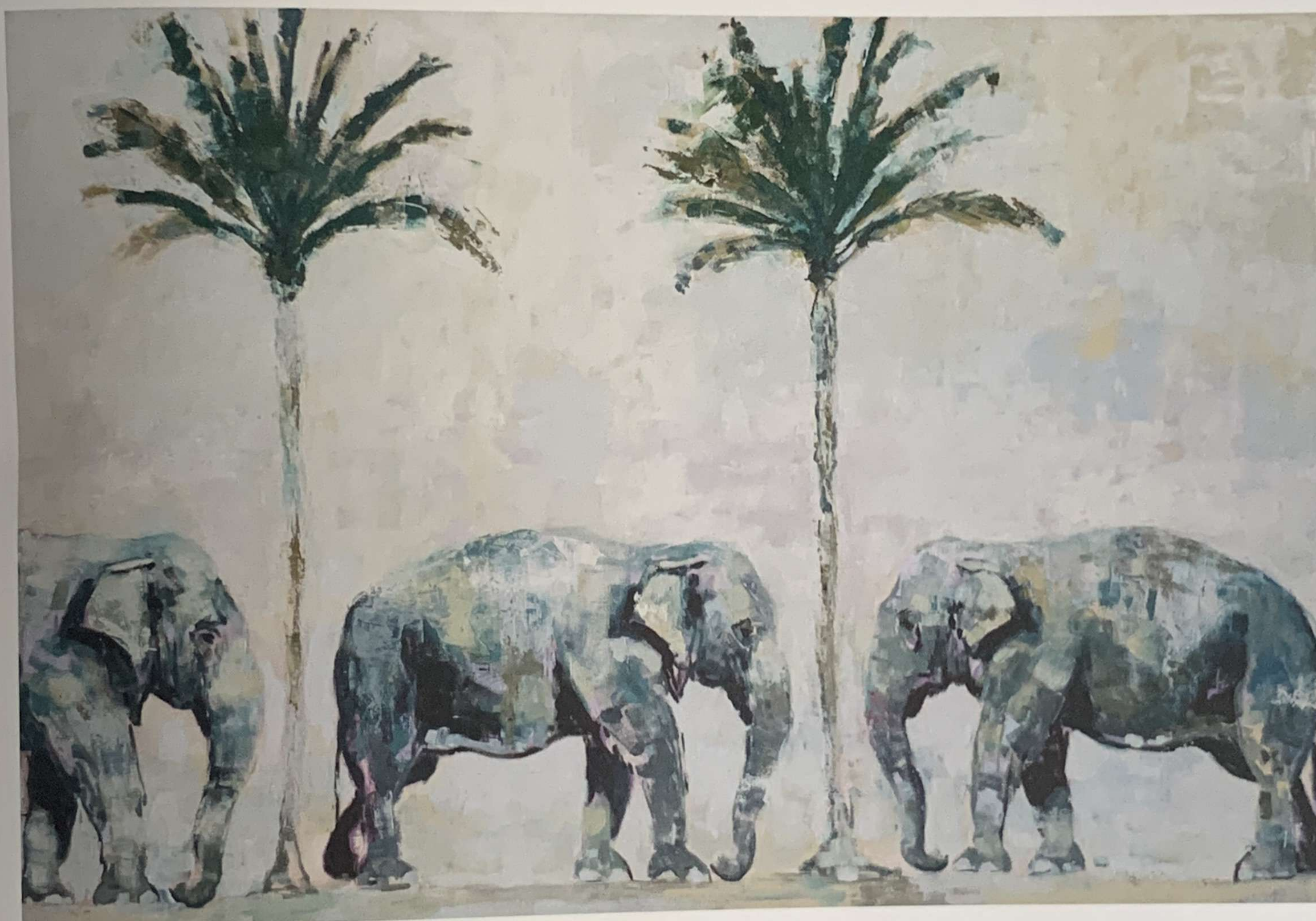
Old Gods and new Gods , 2023, Olio su tela, 122x178 cm.

testa, ma più direttamente degli strumenti nelle mie mani. Nel mio lavoro, alterno pennelli di varie dimensioni, coltelli da pittore e spatole applicando infiniti strati di materia. I miei dipinti si presentano in parte "spogliati", in parte costruiti, rendendo evidente il processo di creazione dell'opera e soddisfacendo il mio desiderio di ottenere una rappresentazione visiva del tempo che passa, energia dell'eternità. In "Garlic & Gasoline", seguendo la mia ricerca artistica, concepisco una realtà alternativa metaforica in cui persone e cose familiari entrano nell'universo dell'ignoto e dell'inaspettato. Nel corso della mia vita ho capito che gli animali sono i perfetti portatori delle mie visioni. Sono sempre stato incuriosito dal modo in cui gli esseri umani utilizzavano gli animali come simboli per le loro storie attraverso la letteratura e l'arte;